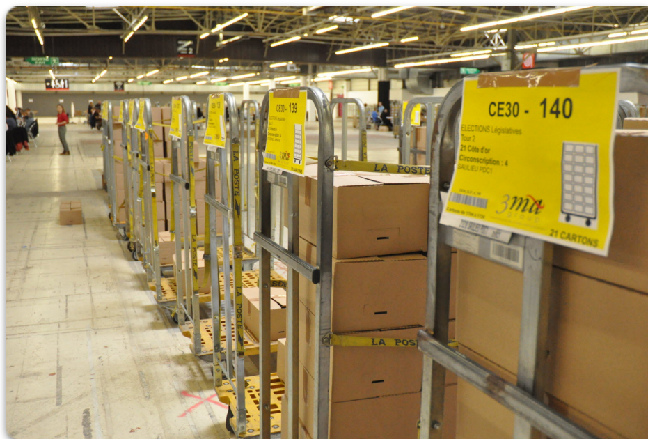
Derrière chaque bulletin, une logistique millimétrée, Le Bien Public (2024)